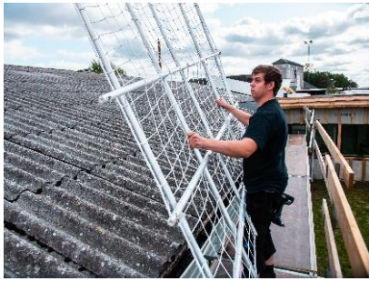
Nettet ligges færdigmonteret ud på taget på det ønskede sted