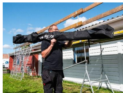
Net-Op opbevares og transporteres i medfølgende kanvas pose