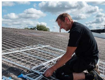
Top-nettet monteres, så skruerne løsnes i toppen af pladen, der skal skiftes