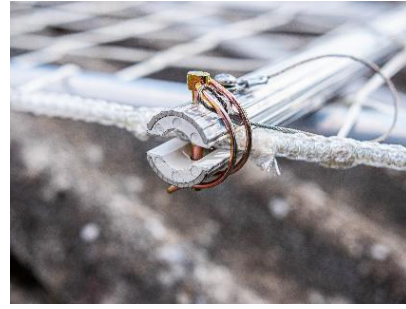
Sikkerhedslås for at sikre at nettet ikke skrider ud af rørene ved brug