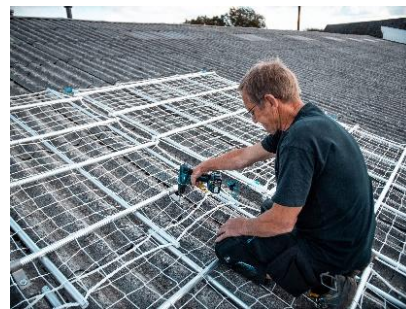
Flere Basic net monteres for sikring imod fald til siderne