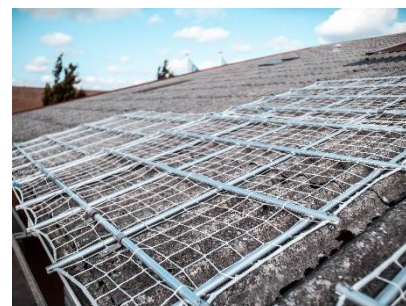
Her ses flere net færdigmonteret på en tagkonstruktion