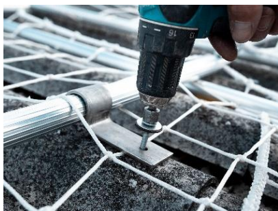
Beslagene gøres fast i nederste rør - husk nye tagskruer