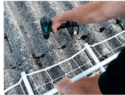
Montøren er ved at løsne top skruerne ved brug af Top-net